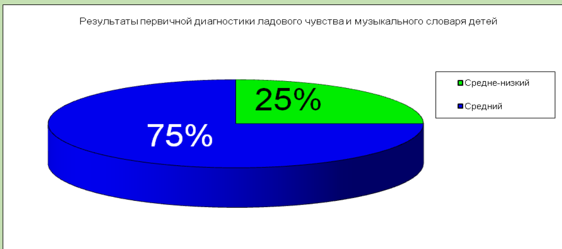
Рис. 1 Результаты первичной диагностики ладового чувства и музыкального словаря детей.

По результатам первичного и вторичного исследований были составлены диаграммы, в которых хорошо видны изменения накопившихся знаний детей в период диагностирования.